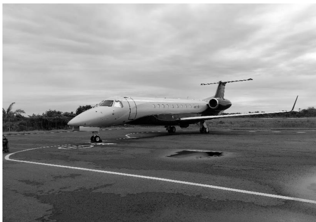
Gambar 7. Pesawat Embraer 135