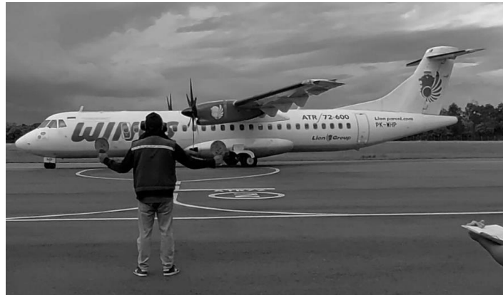
Gambar 5. Pesawat ATR 72 – 600 milik maskapai Wings Air di Bandar Udara Rahadi Oesman