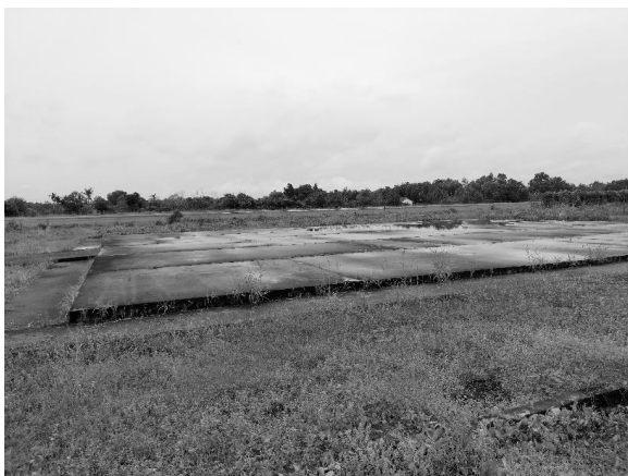
Gambar 8. Kondisi Permukaan Helipad