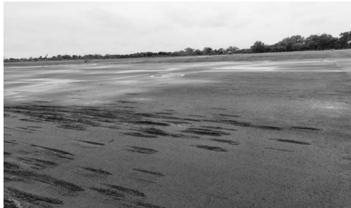
Gambar 2. Kondisi permukaan parking stand