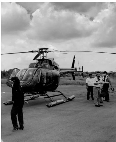
Gambar 6. Helikopter Bell 407