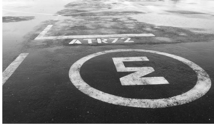
Gambar 4. Marka parking stand dari dekat