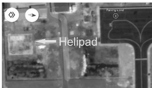
Gambar 8. Letak helipad bandara Rahadi Oesman