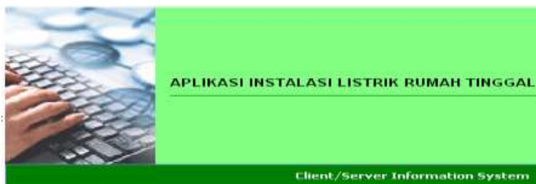
Gambar 2 Window Splash Screen

Pertama kali aplikasi dijalankan, dimunculkan sebuah window splash screen yang bertujuan untuk memberitahu user mengenai aplikasi yang sedang dijalankan. Tampilan windows splash screen dapat dilihat pada gambar 2 di bawah ini.