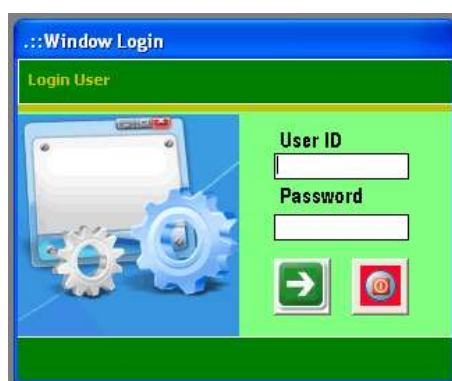
Gambar 3 Window Login

Selanjutnya dimunculkan window login . Window login menghendaki user mengisikan user id dan password untuk dapat masuk ke sistem.