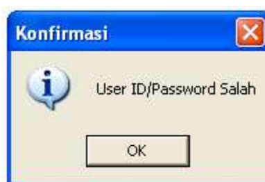
Gambar 4 Peringatan Sistem Ketika User Id/Password Salah

Jika user berhasil login ke sistem, maka akan dimunculkan window menu utama. Tetapi jika user id atau password yang dimasukkan salah, maka akan dimunculkan peringatan oleh sistem seperti diperlihatkan pada gambar 4 di bawah ini.